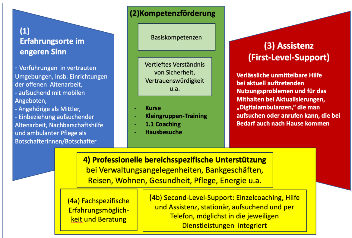
Abb. 2: Kategorien von Angeboten für die Ermöglichung Digitaler Teilhabe im Alter (Eigene Darstellung)

Zurzeit wird die digitale Teilhabe älterer Menschen auf Bundes- und Länderebene vor allem über Erfahrungs- und Lernorte gefördert, die Vorbehalte abbauen sollen, in dem sie erste positive Erfahrungen mit der Nutzung digitaler Medien ermöglichen, insbesondere Kommunikation mit Angehörigen und Bekannten sowie gezielte Informationssuche mit Suchmaschinen. Die überwiegend aufzusuchenden stationären Einrichtungen, die als Erfahrungsorte fungieren, werden nur von ca. 20% der älteren Menschen aufgesucht. Viele Ältere mit eingeschränkter Mobilität wünschen sich Hausbesuche oder eine telefonische Hotline. Vor allem aber befähigten die derzeitigen Angebote nicht zu den höherschwelligen und komplexeren Anwendungen in den Bereichen Verwaltung, Gesundheit, Smart Home u.a., die erst eine umfassende digitale Teilhabe ermöglichen. Dies wird jedoch für eine soziale Teilhabe immer wichtiger, weil zunehmend analoge Angebote eingeschränkt werden. Daher ist es eine neue Aufgabe der Daseinsvorsorge, für entsprechende Infrastrukturen zu sorgen (Kubicek 2022). Es gibt aber bisher auf Landesebene und kommunaler Ebene und auch in der wissenschaftlichen Diskussion keine umfassenden Konzepte, auf welchen Wegen es nach den einführenden Angeboten weitergehen soll, um echte Teilhabe zu ermöglichen. Abschließend soll dazu ein erster Vorschlag zur Diskussion gestellt werden, nach dem insgesamt vier Kategorien von Angeboten erforderlich sind, die aufeinander abgestimmt werden müssen und kooperieren sollten.